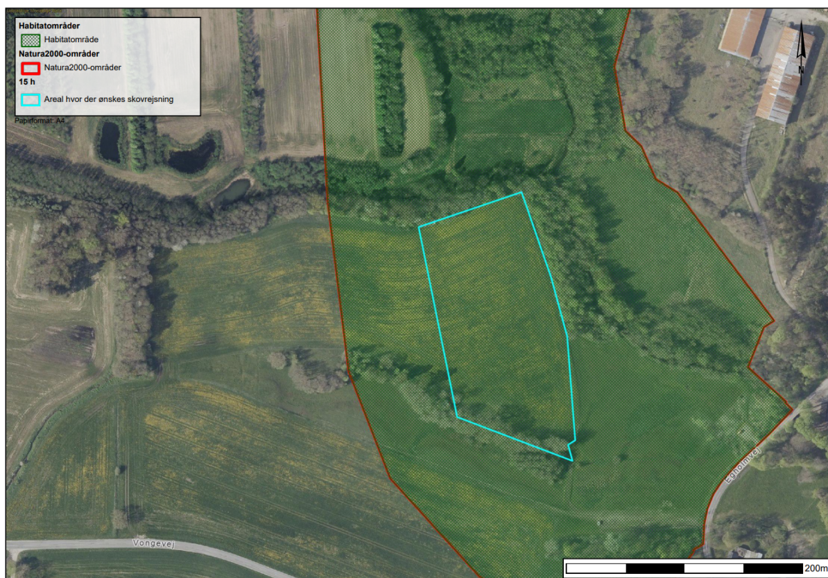
Figur 9. Natura 2000 område

På den baggrund vurderes projektet ikke at påvirke arter eller naturtyper som Natura 2000 området er udpeget for at beskytte.