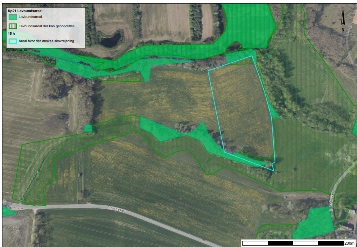
Figur 5. Lavbundsarealer

Da lavbundsarealerne i området i forvejen er beplantede med skovbevoksning, vurderes det ikke, at der er konflikt i rejsning af skov i forhold til den lille del af området med lavbundsjarde.