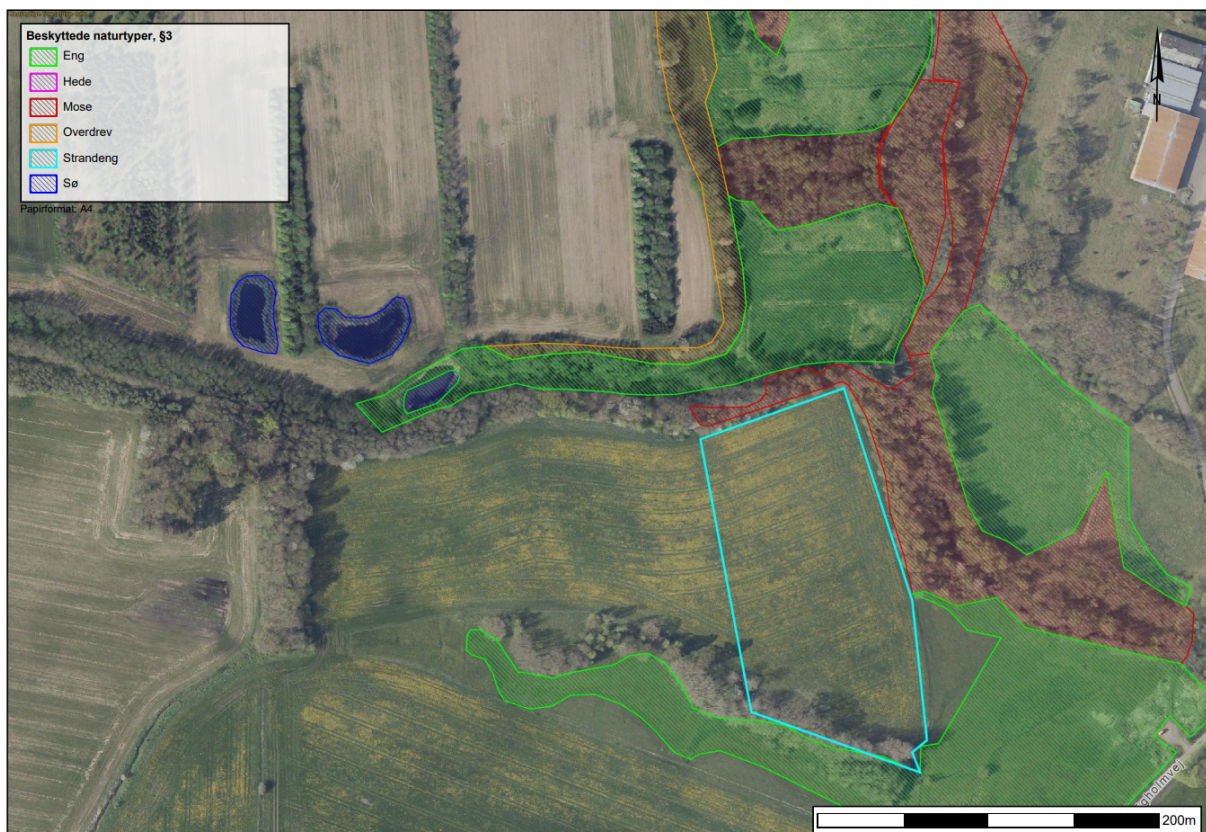
Figur 3. Registreret §3 natur i tilknytning til arealet hvor der ønskes skovrejsning

Vi gør opmærksom på, at vi ønsker at man tilgodeser naturen i området, ved at undgå træarter som ikke spreder sig eksplosivt, f.eks. bævreasp.