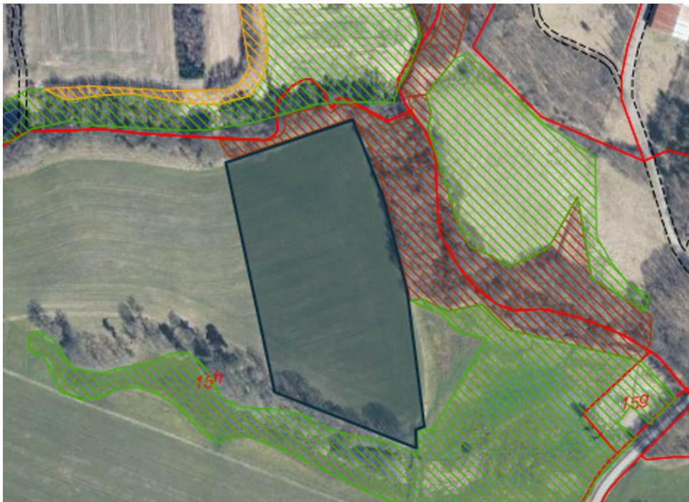
Figur 1. Kort over ønsket skovrejsningsområde. Kortet er udarbejdet af Kirkbi Invest A/S.

Ansøgningen er sendt på vegne af Kirkby Invest A/S, der ønsker et område på ca. 2 ha beplantet.