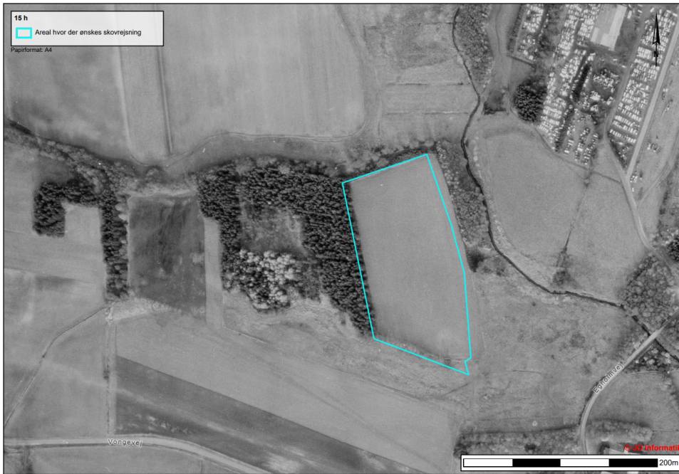
Figur 7. Luftfoto fra 1972, der viser den del af det fredede område, der ikke er tilplantet med skov, og som ønskes friholdt for skov jvf. Fredningen "Gudenåens kilder".