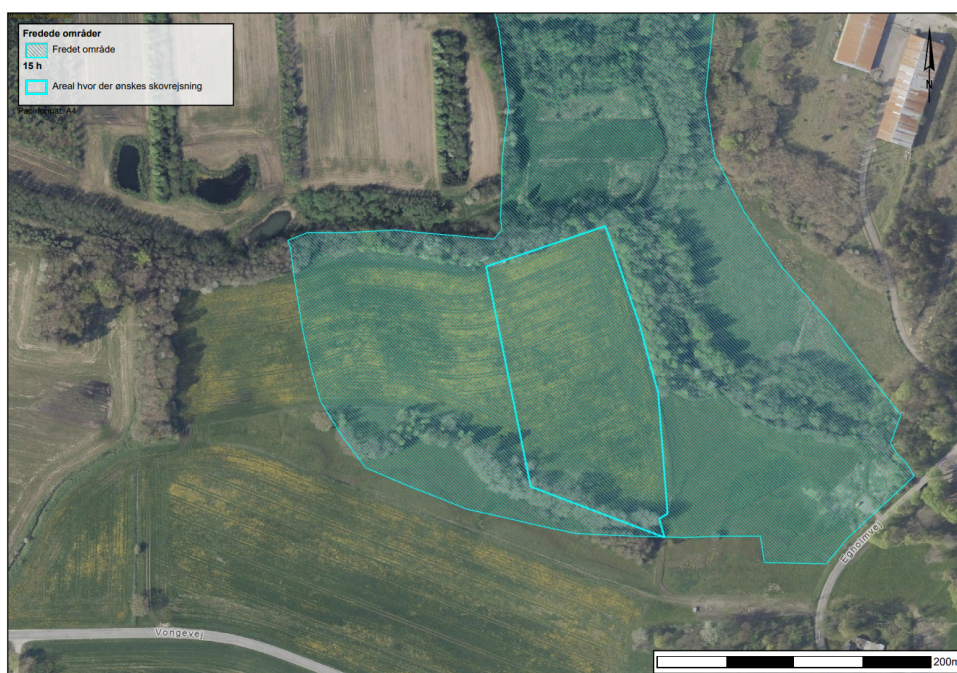
Figur 6. Fredningen "Gudenåens kilder" rækker ind i området hvor skovrejsningen vil etableres.

Arealet markeret med mørkegrøn på figur 7. må jf. §3 stk. c tilplantes hvis arealerne var træbevokset d. 1. januar 1973. Dette gør sig ikke gældende for den del af fredningsarealet (se figur 6), og Hedensted Kommune vurderer derfor, at denne del af fredningen ikke kan beplantes igen uden Fredningsnævnets dispensation.