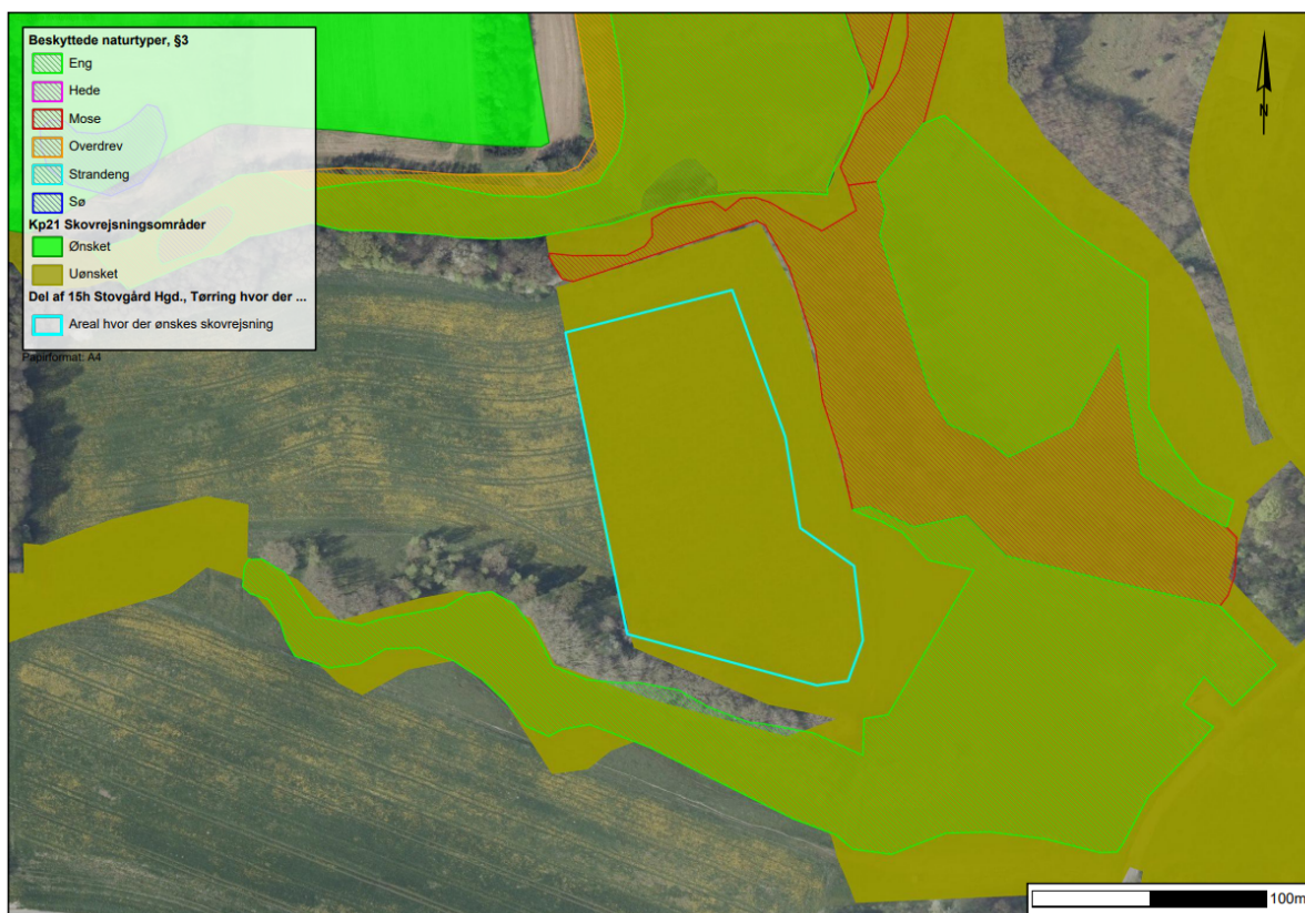
Figur 2. Det omtrentlige areal som Hedensted Kommune kan give tilladelse til at rejse skov indenfor, såfremt Fredningsnævnet giver dispensation. På kortet ses §3 beskyttet natur samt arealer med skovrejsning uønsket. Arealet udgør ca. 1,4 ha.

Det ønskede skovrejsningsområde ligger inden for areal med skovrejsning uønsket, da det er udpeget i Fredningen "Gudenåens Kilder", at arealet skal holdes lysåbent. Hedensted Kommunes afgørelse, er derfor kun gældende, såfremt der gives dispensation til at rejse skov af Fredningsnævnet for Midtjylland, Østlig del.