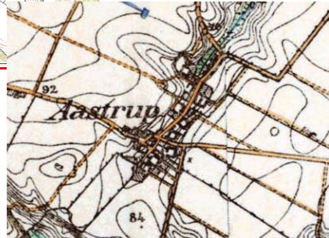
Generalstabskort udarbejdet 1842 -1899