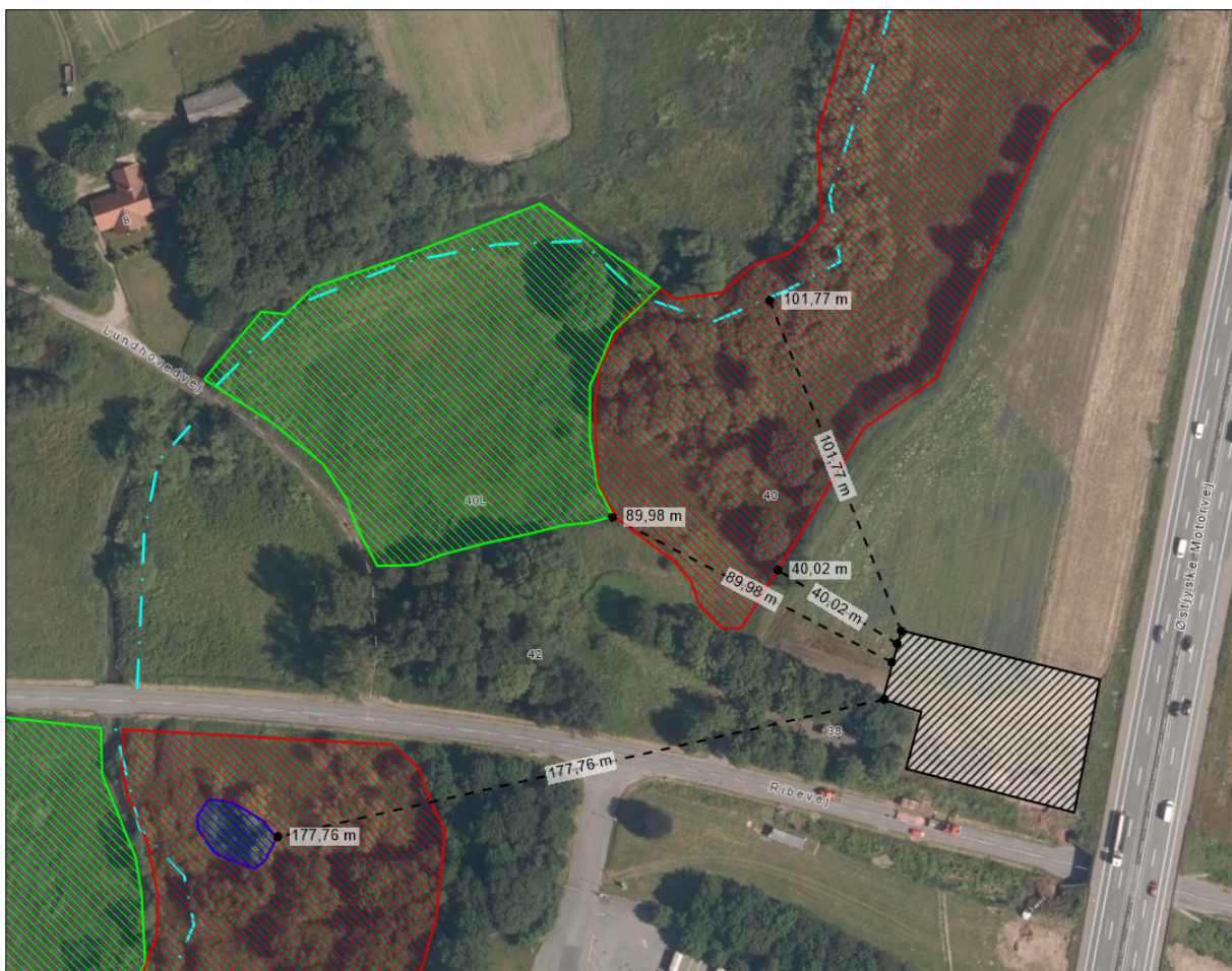
Figur 1. Nære § 3-beskyttede naturområder (vejledende opmålinger på kort).

Lyseblå: Beskyttet vandløb Rød: § 3 beskyttet mose Lysegrøn: § 3 beskyttet eng Mørkeblå: § 3 beskyttet sø