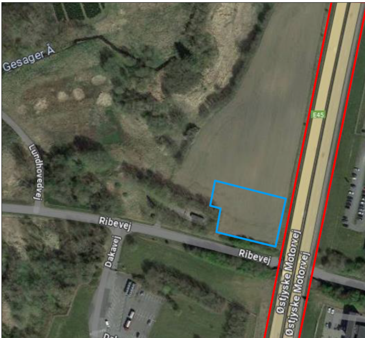
Figur 2. Kortet viser placering af projektområdet, hvorfra der skal afgraves rabatjord fra vejmatrix (rød markering). Pladsen til oplag af rabatjord (areal: 2500 m 2 ) er markeret med blåt (indsendt af Rambøll, Olof Palmes Allé 22, 8200 Aarhus N).