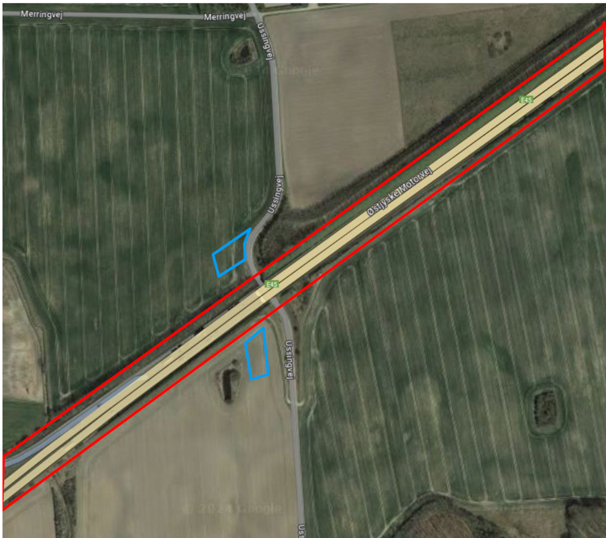
Figur 2. Kortet viser placering af projektområdet, hvorfra der skal afgraves rabatjord fra vejmatrix (rød markering). Pladserne til oplag af rabatjord (samlet areal: 2400 m 2 ) er markeret med blå (kort indsendt af Rambøll, Olof Palmes Allé 22, 8200 Aarhus N).