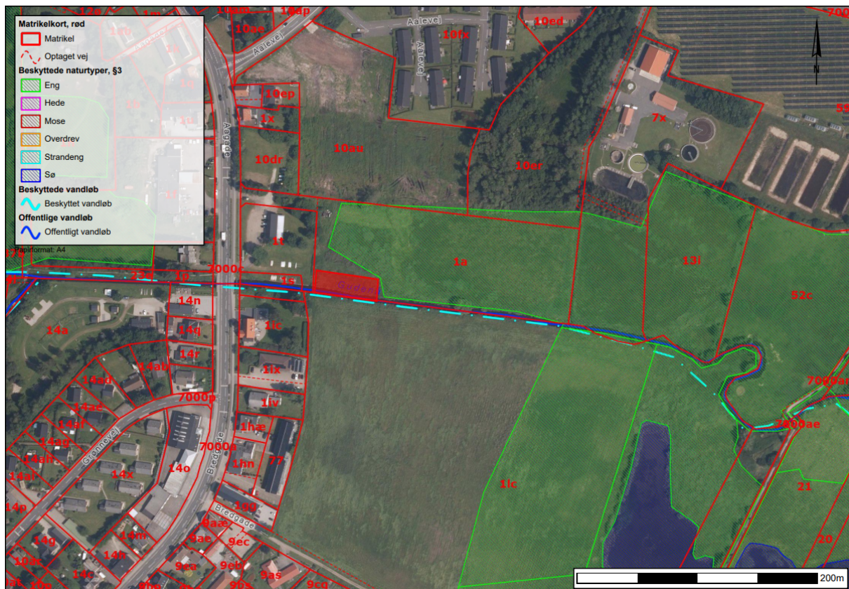
Figur 1. Ortofoto 2024. Sandfangets placering i Gudenåen er vist med en rød firkant. Gudenåen og arealerne lige øst for sandfanget er § 3-beskyttet. § 3-beskyttede arealer fremgår af kortet som skraveringer.