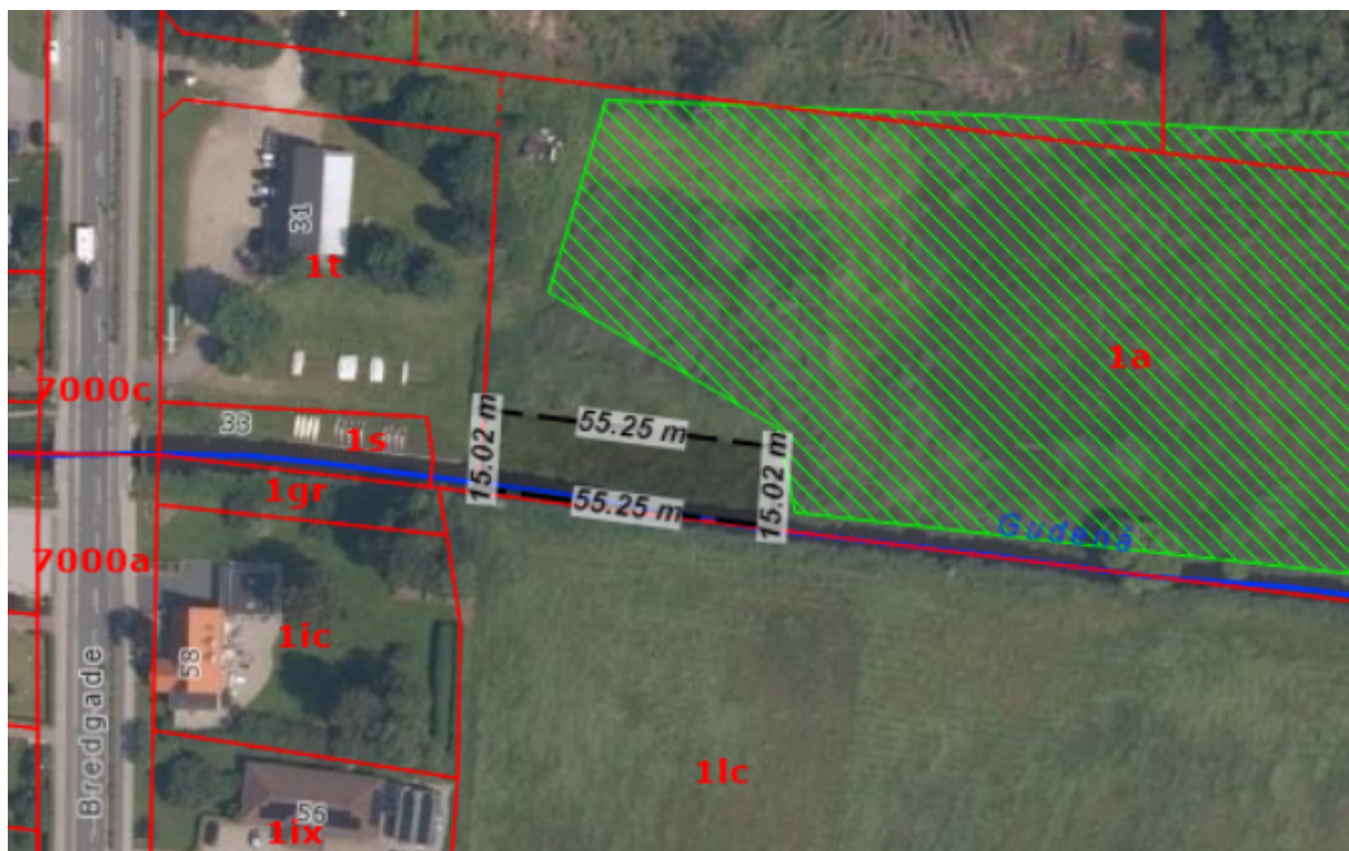
Figur 2. Ortofoto 2024 © Hedensted Kommune. Placering af sandfang på matr.nr. 1a Tørring By, Tørring i Gudenåen.

Det forventes, at sandfanget skal tømmes 2-4 gange årligt.