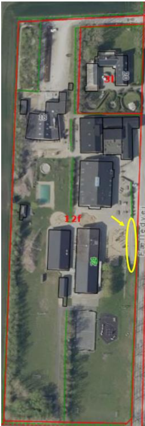
Den omtrentlige placering af det ansøgte vist med gult på luftfoto fra 2024