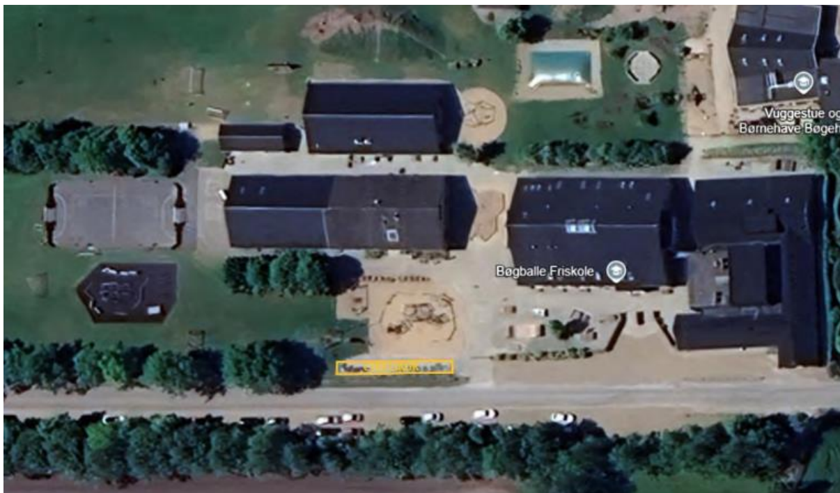
Ansøgers indsendte situaionsplan, hvor det ansøgte cykelskur er indtegnet med gult