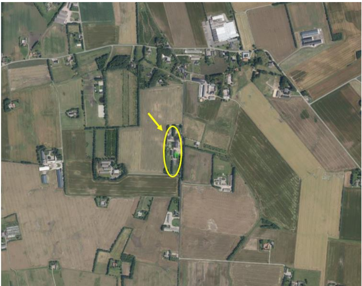
Ejendommens placering i landskabet vist med gult på luftfoto fra 2024

Afgørelsen vil så vidt muligt blive offentliggjort tirsdag den 8. april 2025 ved annoncering på Hedensted Kommunes hjemmeside