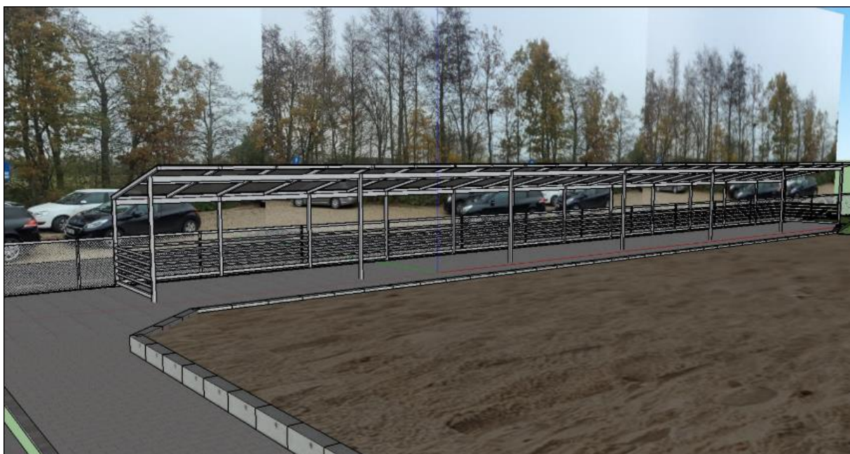
Ansøgers indsendte illustration af cykelskurets facade set fra nordvest