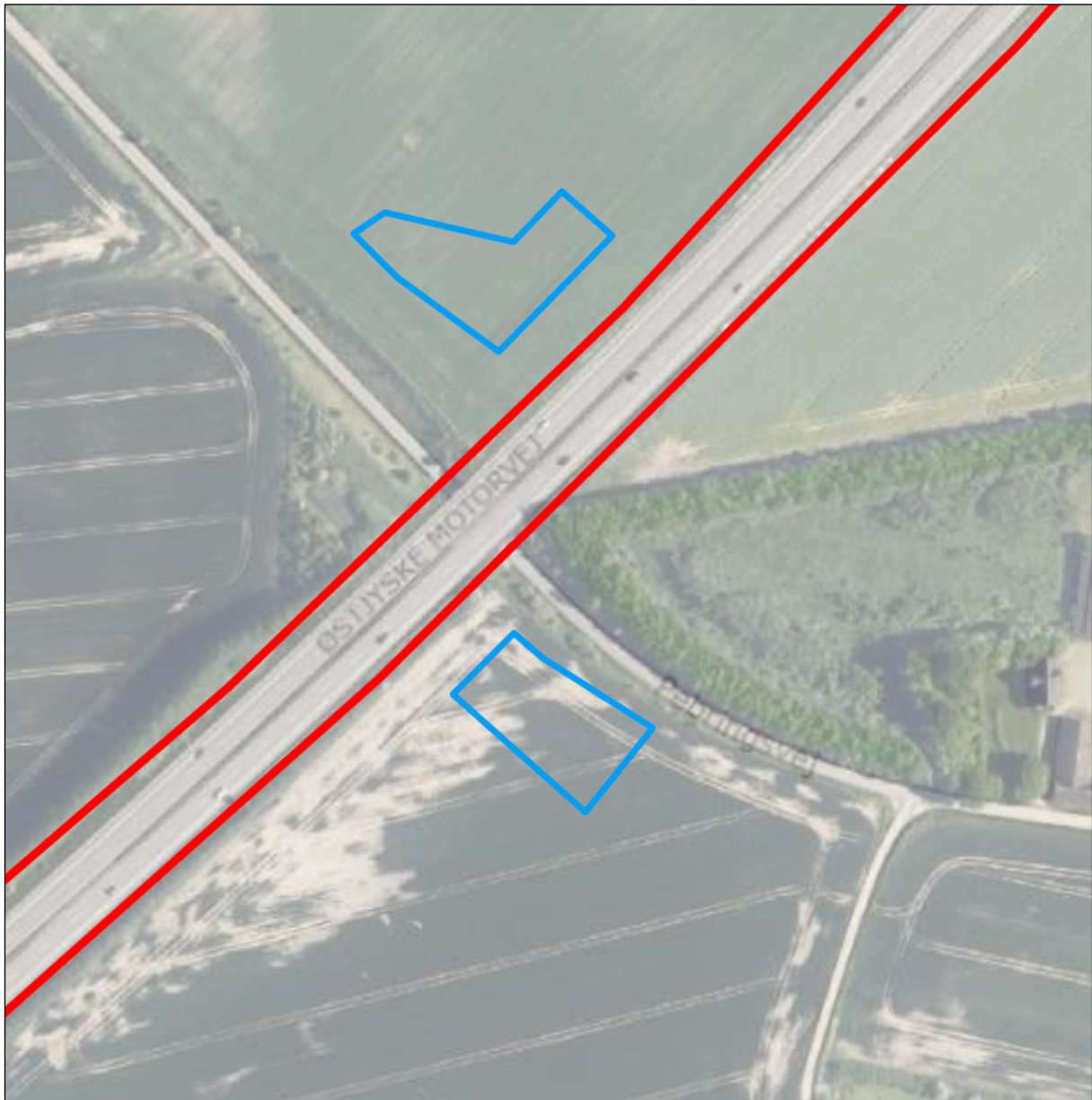
Figur 2. Kortet viser placering af projektområdet, hvorfra der skal afgraves rabatjord fra vejatrikel (rød markering). Pladserne til oplag af rabatjord (samlet areal: 3000 m 2 ) er markeret med blåt (kort indsendt af Rambøll, Olof Palmes Allé 22, 8200 Aarhus N).