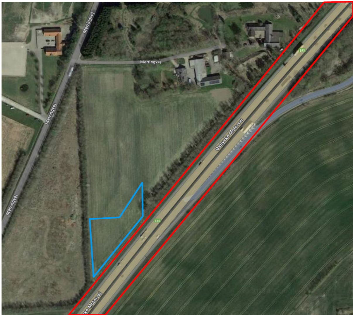
Figur 2. Kortet viser placering af projektområdet, hvorfra der skal afgraves rabatjord fra vejatrikel (rød markering). Pladsen til oplag af rabatjord (areal: 2300 m 2 ) er markeret med blåt (indsendt af Rambøll, Olof Palmes Allé 22, 8200 Aarhus N).