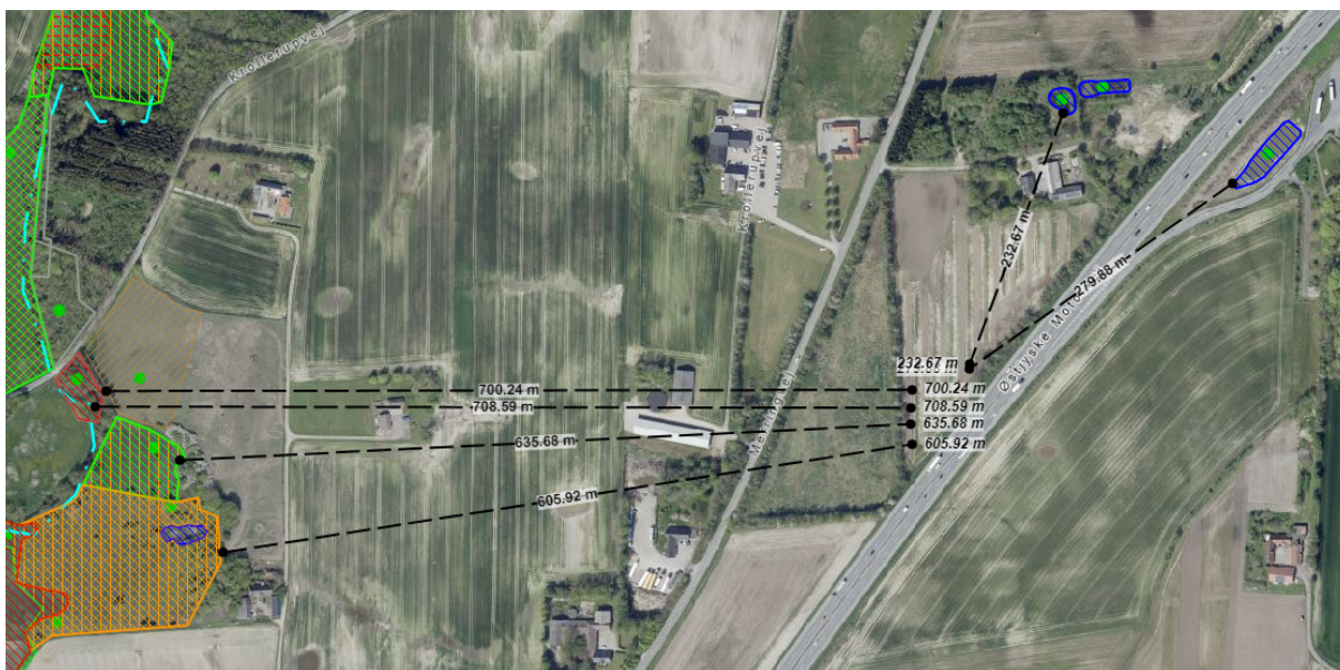
Figur 1. Nære beskyttede naturområder (vejledende opmålinger på kort).