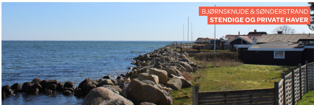
BJØRNSKNUDE & SØNDERSTRAND STENDIGE OG PRIVATE HAVER