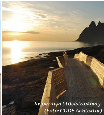
Inspiration til delstrækning.