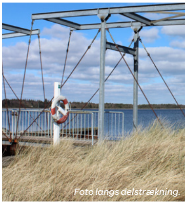
Foto langs delstrækning.