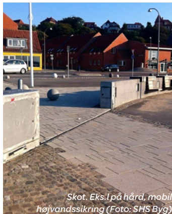
Skot. Eks. I på hård, mobil højvandssikring