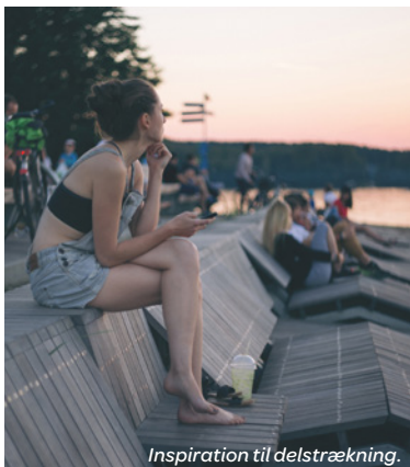
Inspiration til delstrækning.

Herover ses ord, som borgerne ønsker skal kendetegne delområdet Bjørnknude og Sønderstrand i fremtiden. Ordskyen er resultatet fra mentimeter-undersøgelsen.