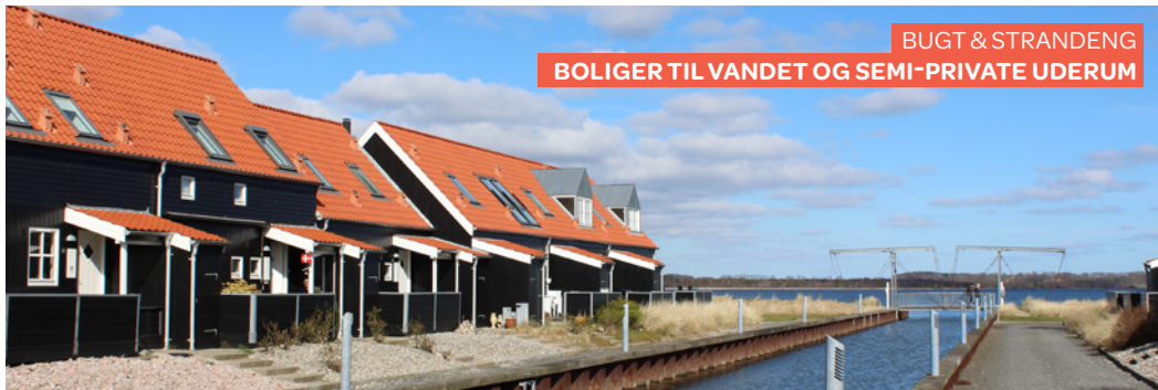
BUGT & STRANDENG BOLIGER TIL VANDET OG SEMI-PRIVATE UDERUM