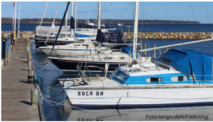
Foto langs delstrækning.