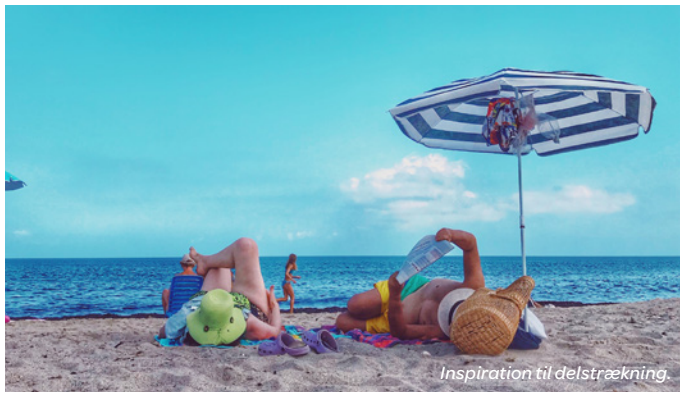
Inspiration til delstrækning.