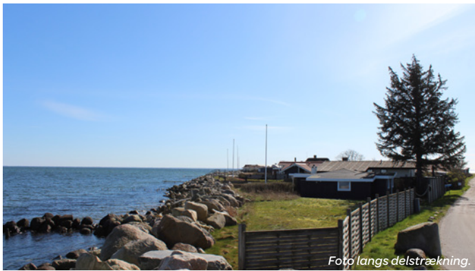
Foto langs delstrækning.