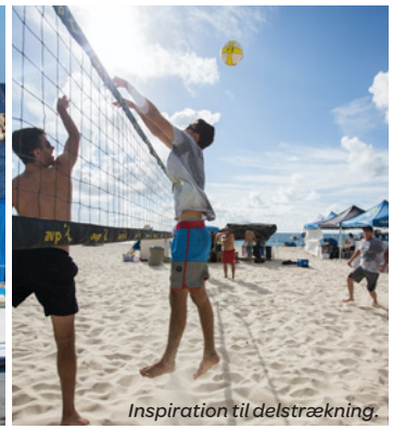
Inspiration til delstrækning.