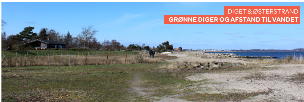
DIGET & ØSTERSTRAND GRØNNE DIGER OG AFSTAND TIL VANDET