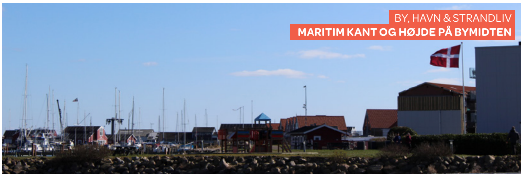
BY, HAVN & STRANDLIV MARITIM KANT OG HØJDE PÅ BYMIDTEN