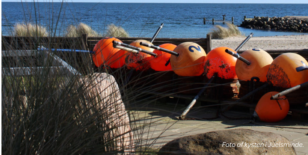
Foto af kysten i Juelsminde.

Takten for hvordan anlæg skal realiseres, kan have betydning for grundejernes evne til at betale. Det betyder, at det skal overvejes i de konkrete løsningsforslag, om løsningerne skal etableres i fuld højde på hele strækningen på få år eller gradvis op til 2,5 meter over flere år. Hedensted Kommune bidrager til anlægget i et vist omfang. Fordeling af udgifter og ansvar for drift skal afklares nærmere.