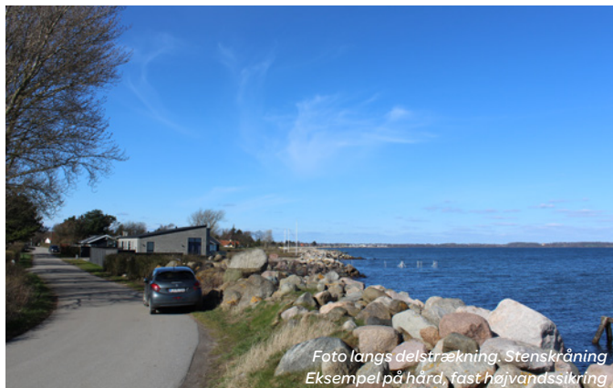
Foto langs delstrækning, Stenskråning Eksempel på hård, fast højvandssikring