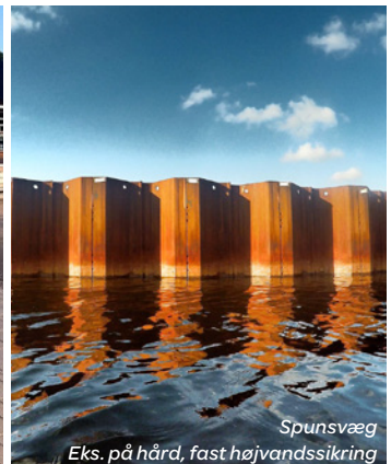
Spunsvæg Eks. på hård, fast højvandssikring