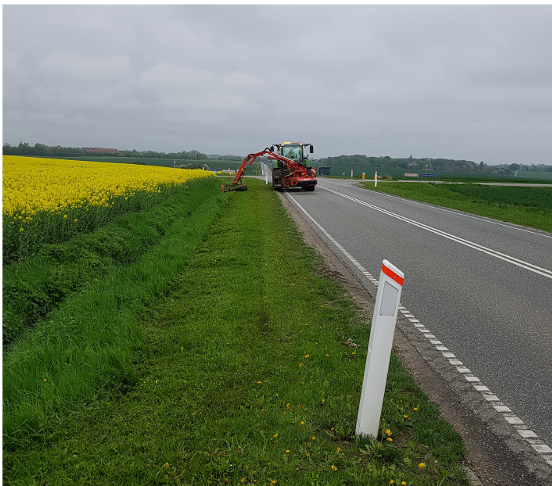
Slåning af grøftekanter i maj 2021.