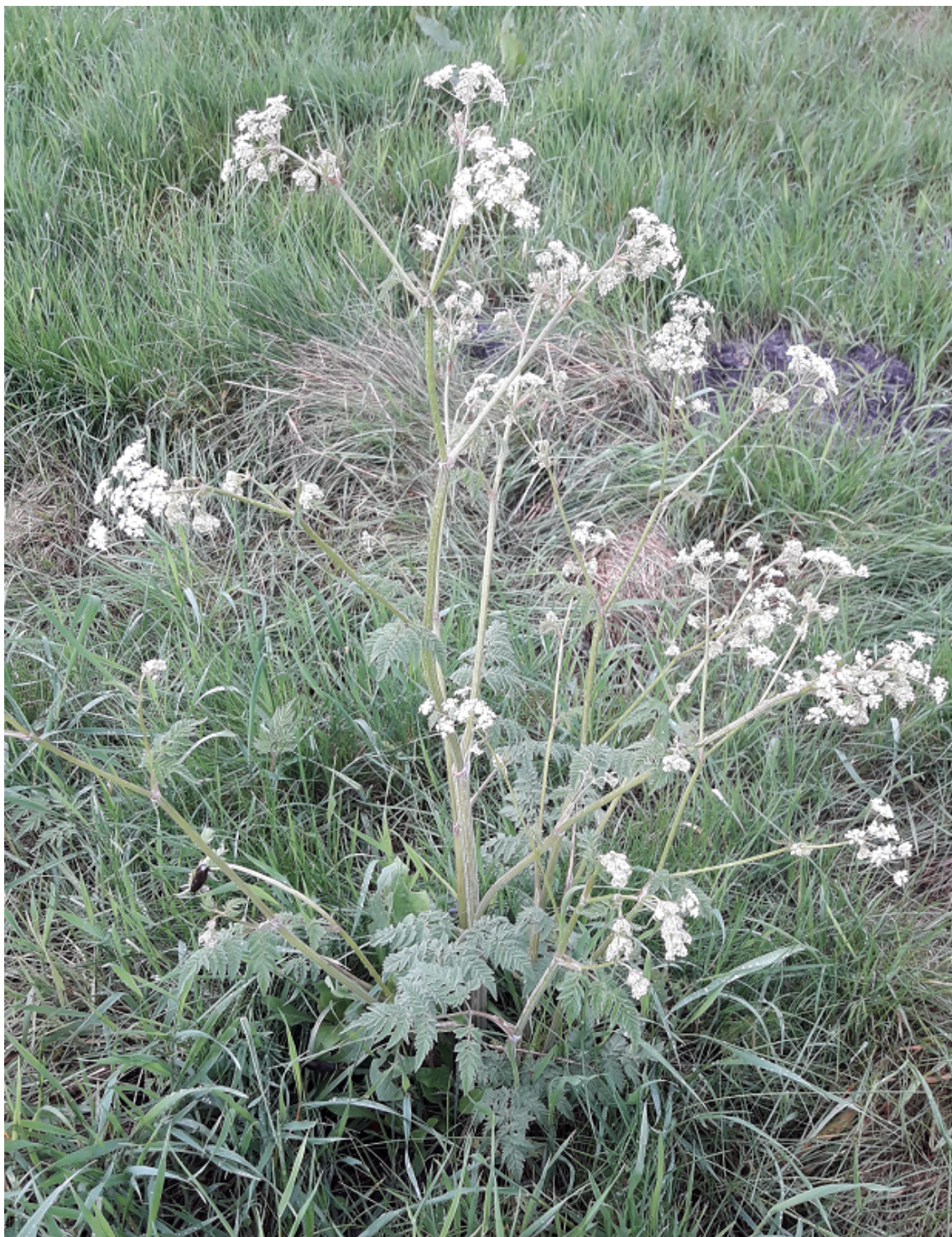
Vild kørvel blomstrende i maj 2021. Efter slåningen skal den nok nå at blomstre igen i løbet af sommeren, bare sammen med flere andre slags urter.