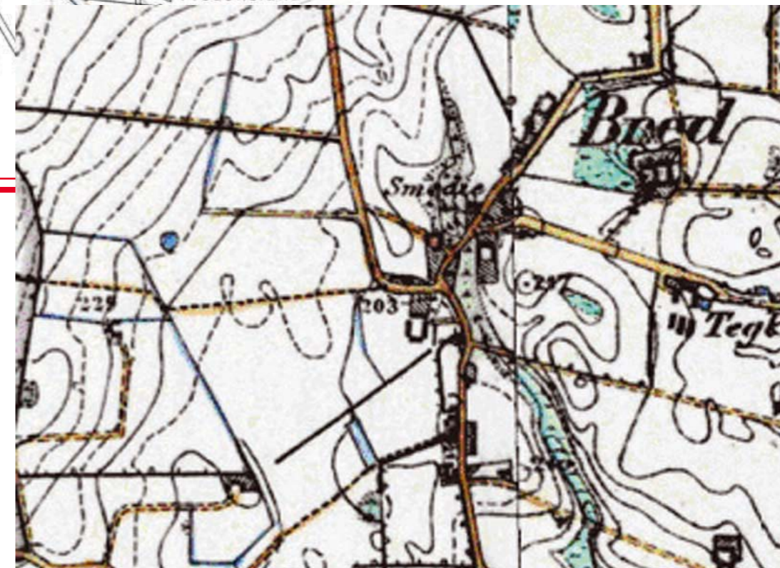
Generalstabskort udarbejdet 1842 -1899