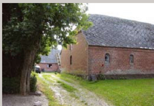
Brethvej 11 er en af landsbyens gårde, som har bevaret alle længer og dermed gårdrummet. Bygningerne trænger til en kærlig hånd.