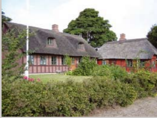
På Kirkebro 11 ligger et af landsbyens mange velholdte og charmerende huse.

Læs her om de vejledende retningslinier for byggeri i landsbyer