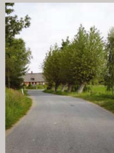
Kig mod nord ad Kirkebro, som på østlig side er veldefineret af en lav tæt træække og vandløb.