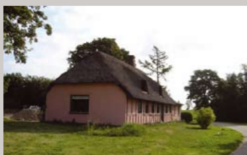
På Lhombrevej 2 ligger et af landsbyens bindingsværkshuse. Denne byggestil er karakteristisk for landsbyen og bør bevares.

På det let skrånende terræn ned mod Vejle Fjord, nord for Vejlevej mellem Vejle og Juelsminde ligger Breth. Det formodes, at landsbynavnet mangler den sidste endelse, -with, som betyder skov. I navnets ældste form finder man desuden et »n«, nemlig Brent. Derfor kan navnet sandsynligvis have betydning, »brændt ved skov« eller »bred skov«. I dag er landsbyen en fin lille vejklungeby med flere bevaringsværdige bygninger. Nogle gårde er også bevaret og fungerer i dag stadig som landbrug - dog ikke alle med de traditionelle fire længer.