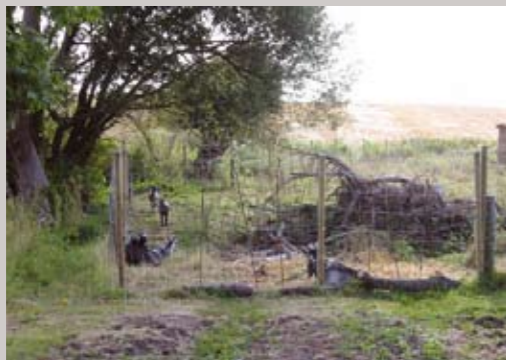
Den hyggelige landsbystemning understreges af indhegningen midt i landsbyen med geder, som velvilligt stiller op til fotografering.

Udarbejdet af Juelsminde Kommune - november 2005