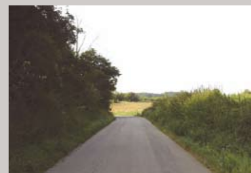
Ankomsten ad Lhombrevej er præget af meget ringe udsyn pga. det skarpe sving og først midt i svinget opdager man landsbyen.