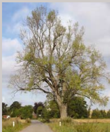
Kig til landsbyen fra øst ad Brethvej med et flot højt træ, som danner en fin ankomst til bebyggelsen