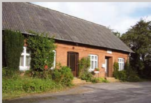
Brugsen lukkede i 1960'erne, bygningen er fra perioden med bedre byggeskik. Brugsens skilt hænger stadig over døren.