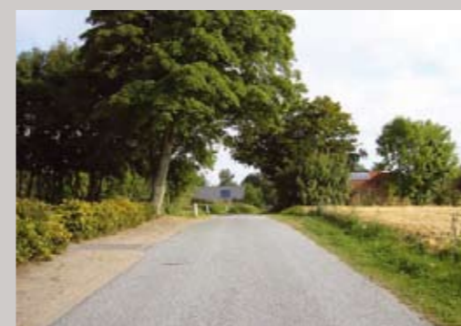
Kig mod nord ad Kirkebro.

Midt i byen ligger en sø, hvorfra der mod syd løber et vandløb langs en del af landsbygaden. Området omkring søen og vandløbet er udlagt som SPL-område (særligt følsomme landbrugsområder), hvilket betyder, at der kan søges tilskud til forskellige miljøvenlige jordbrugsforanstaltninger, der sigter på at beskytte søer, vandløb og værdifulde naturområder. Området er desuden udlagt af Vejle Amt som lavbundsområde og karakteriseret som særlig værdifuldt naturområde, hvor det gælder, at området skal bevares som naturområde med et mangfoldigt og varieret plante- og dyreliv og potentielt vådområde.