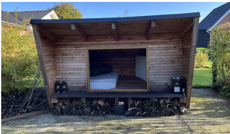
Ansøgers fremsendte foto af shelter