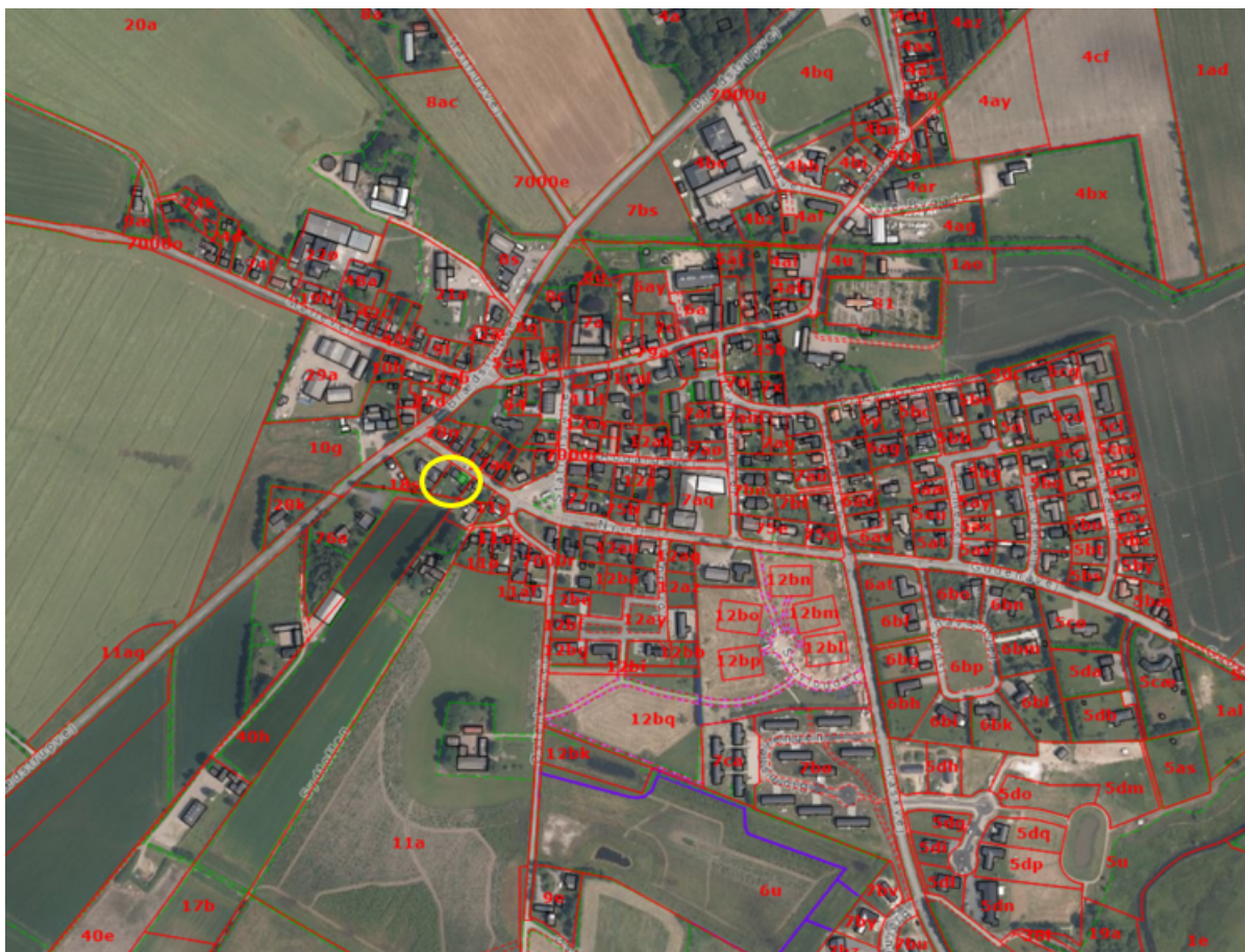
Ejendommens placering i landskabet vist med gul ring på luftfoto fra 2023.

Afgørelsen vil så vidt muligt blive offentliggjort tirsdag den 28. januar 2025 ved annoncering på Hedensted Kommunes hjemmeside